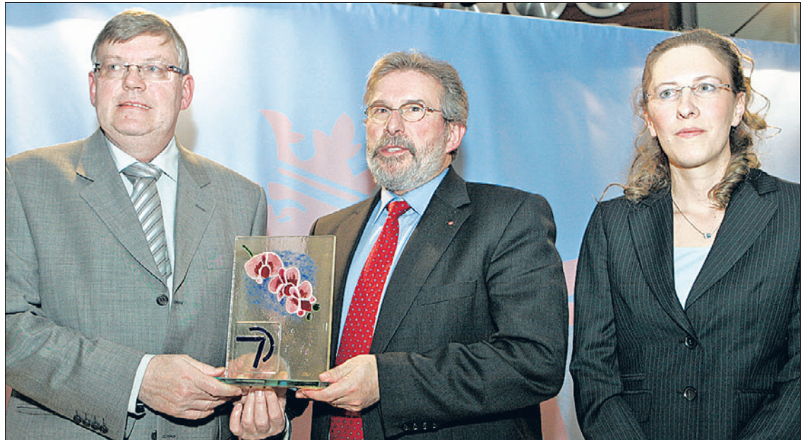
Die Klinik St-Joseph in Wiltz konnte die Jury überzeugen und durfte somit in Bad Mondorf die Auszeichnung aus den Händen des Gesundheitsministers Mars Di Bartolomeo entgegennehmen.